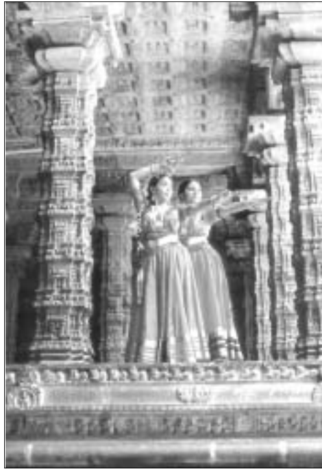
चिदम्बरम मंदिर में नाचते हुए कमलिनी-कमलिनी (इंडिया पर्सपेक्टिव, जुलाई २००० का पिछला आवरण पृष्ठ)