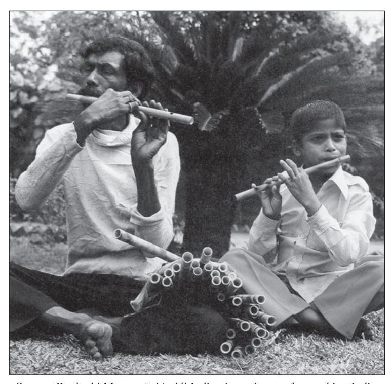
Source: Reginald Massey (ed.), All India: A catalogue of everything Indian , Apple Press Ltd, London, 1989, p. 64